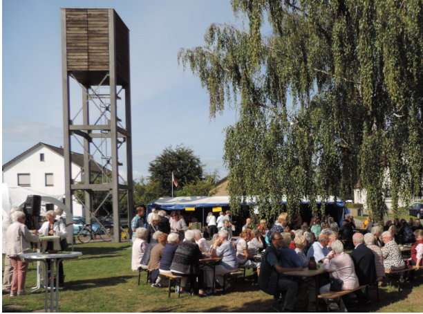
200 Besucher trafen sich im Garten

de hat sich in diesem Jahr an zwei Popstücke herangewagt und sie auf dem Fest zum ersten Mal aufgeführt.