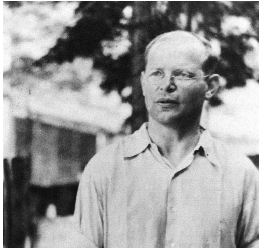
Dietrich Bonhoeffer während der Zeit der Gefangenschaft