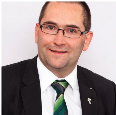
Superintendent Albrecht Preisler

Vom 30.10.2022 bis zum 27.11.2022 wird die Region Nord-West des Kirchenkreises Wesermünde durch Superintendent Albrecht Preisler visitiert. Zur Region gehören die Kirchengemeinden Spaden, Debstedt, Langen und Neuenwalde mit der Kapellengemeinde Hymendorf.