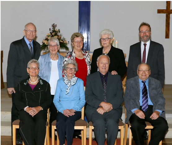
Gnaden- und Kronjuwelenkonfirmation

A uch in diesem Jahr konnten wir wieder Jubiläumskonfirmationen in unserer Kirchengemeinde feiern.