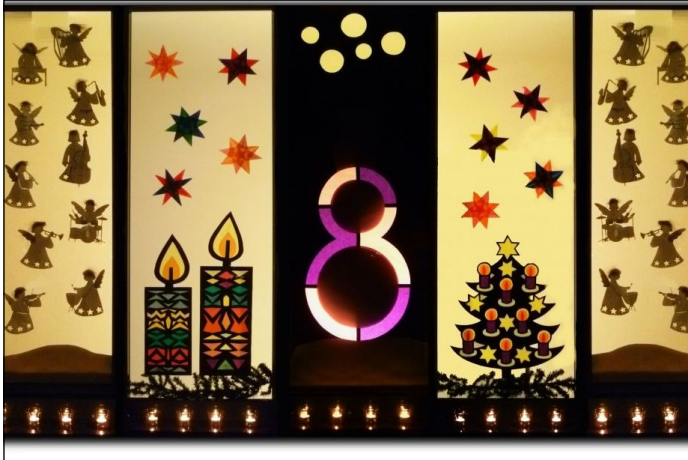
Achten Sie auf die Nummern in den Fenstern

In diesem Jahr soll wieder ein Lebendiger Adventskalender in Spaden und Laven stattfinden. Leider haben wir in diesem Jahr zum ersten Mal den Kalender nicht vollbekommen. Das ist sehr schade. Die beteiligten Familien laden ein. Sie öffnen sozusagen ein Türchen für die Gemeinde. Täglich um 18.00 Uhr treffen sich Kinder, Jugendliche und Erwachsene vor der Haustür einer Familie, die ein Fenster mit der Zahl des jeweiligen Türchens dekoriert hat.