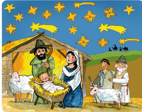
Rätsel: Welcher Stern ist wirklich einmalig?